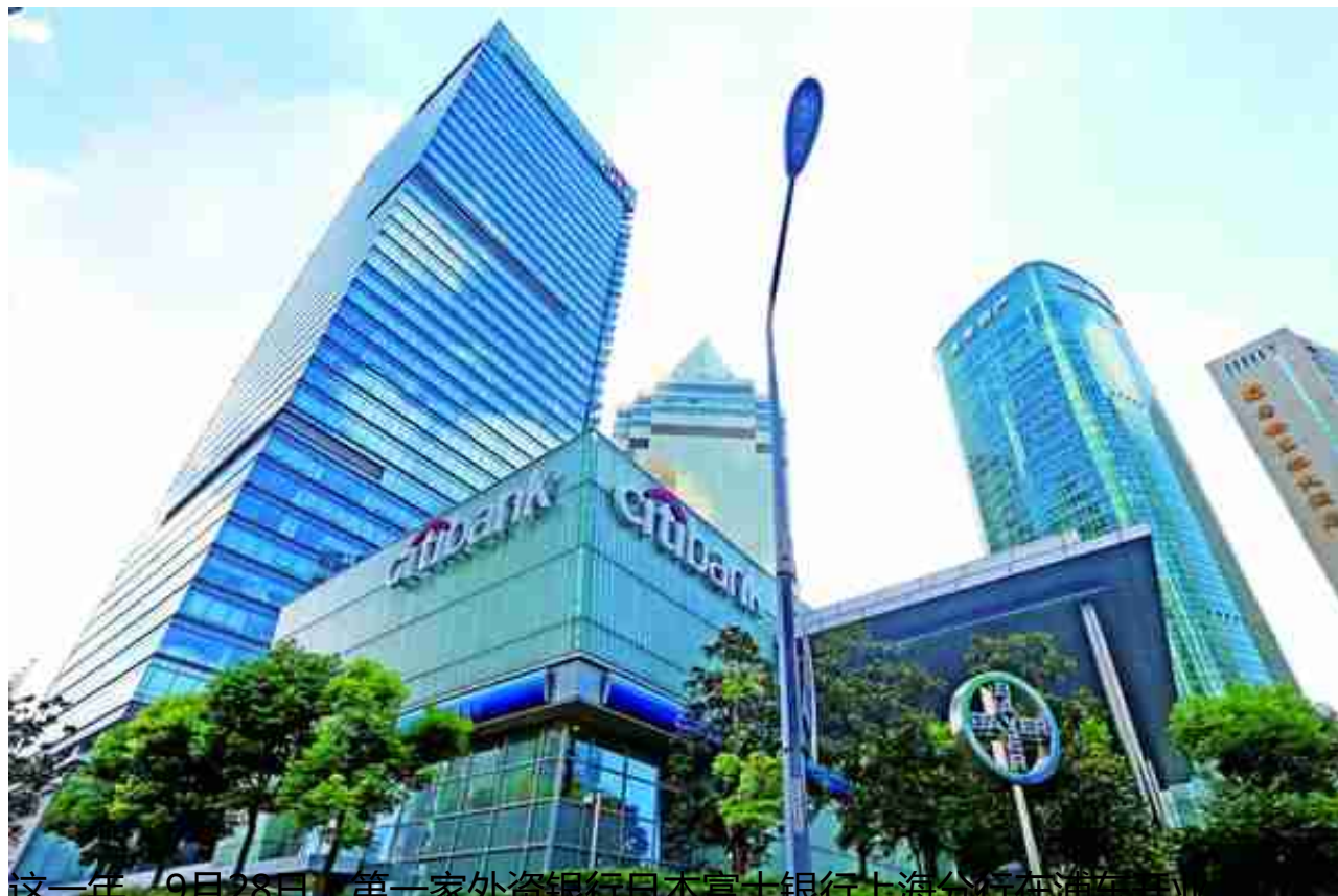
这一年，9月28日，第一家外资银行日本富士银行上海分行在浦东开业。