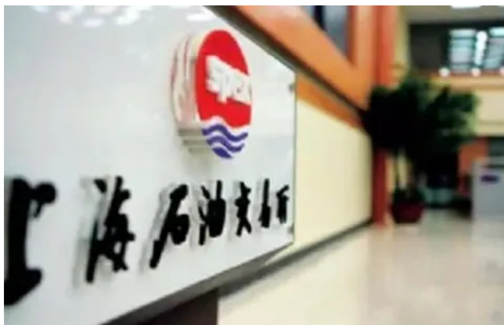
这一年，上海石油交易所正式营业，这是继证券交易所、期货交易所、钻石交易所等机构落户浦东的又一重要要素市场。