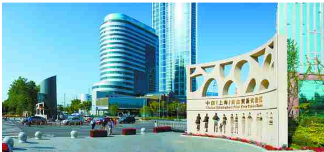
这一年，10月24日，全国第一家中外合资外贸公司兰生大宇贸易公司在外高桥保税区注册成立。