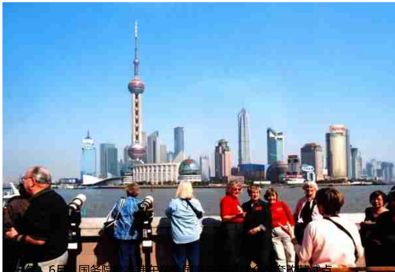
这一年，6月，国务院批准浦东在全国率先开展综合配套改革试点。