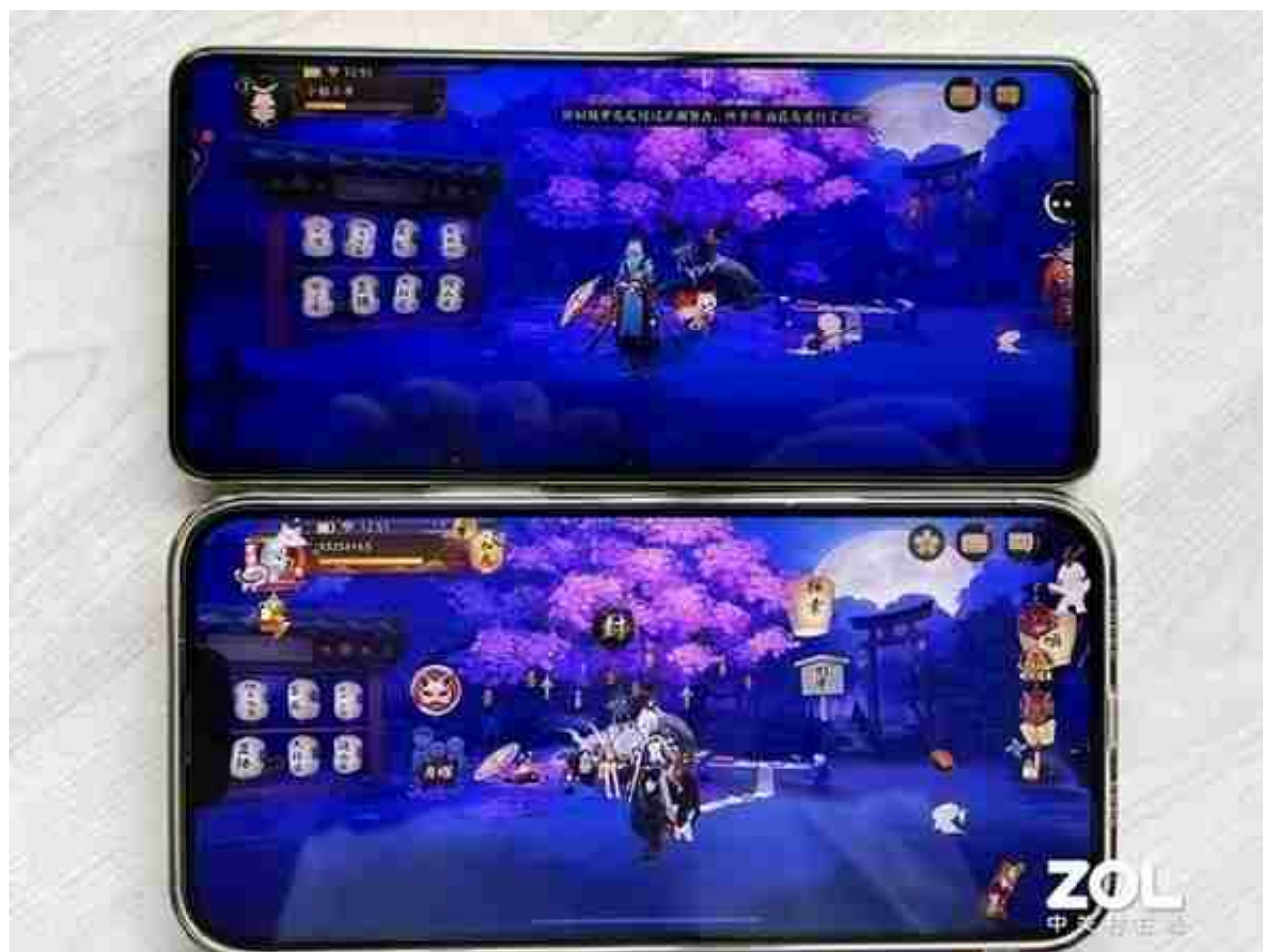
上为iQOO Neo6，下为 iPhone 13 Pro Max

在功能方面，iQOO Neo6支持LTM阳光显示以及VSR可变分辨率渲染技术，可以根据外部的光线变换及时调整屏幕的显示方案，亮部不过曝，暗部有细节，显示内容更清晰，视觉体验更平滑，增强重点显示区域画面的细腻程度。通过这两项屏幕技术，iQOO Neo6不仅实现了高帧率、低功耗的屏幕显示，还具有优化视觉体验、提升画面流畅度等优势。