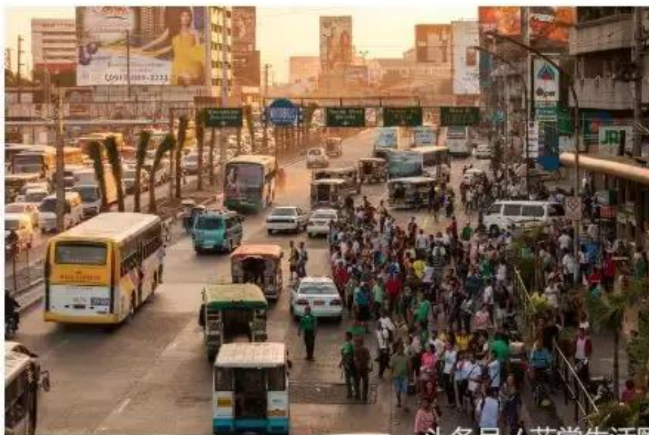
头条号 / 非常生活圈