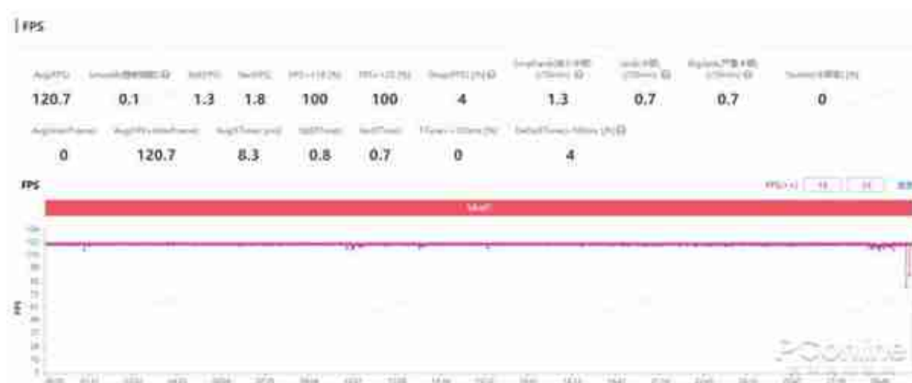
(《王者荣耀》游戏帧率图)

其次就是各项独家自研技术。有了硬件的支持外，还需要强大的自研软件技术的配合，一加 Ace 2搭载了一加 11同款的内存基因重组技术，从系统底层入手去重构内存，借助瞬时带宽技术、异步内存技术等等，让一加 Ace 2真正地实现了系统级的极致流畅体验。