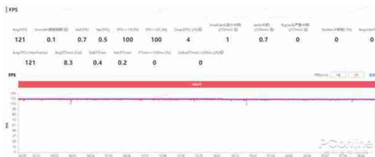
(《英雄联盟》游戏帧率图)