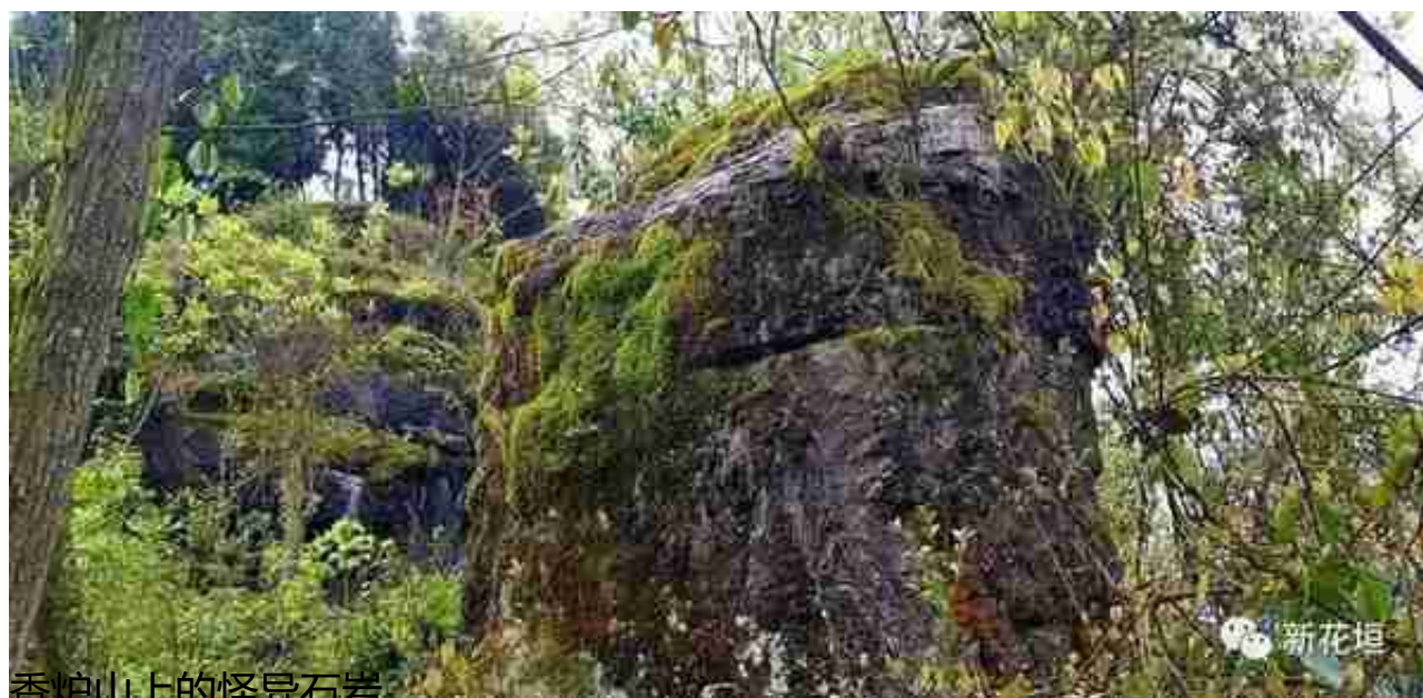
香炉山上的怪异石岩

在小镇背靠清水江边有一座大青山，山上有一块巨石直径高约三米，形如香炉，称做香炉山。阳光明媚的大清晨起来，透过小镇上郁郁葱葱的树林从山上去眺望，会看见这香炉山上的大巨石上袅袅升起着一股淡淡的形似白色的烟霾，直到东边挂出了一轮红日，才自然消散。