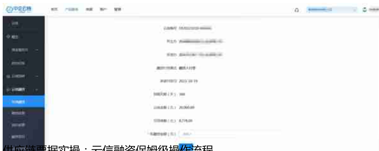
供应链票据实操：云信融资保姆级操作流程

资金方提供报价后，申请人手机会收到短信提醒。登录审核人账号，在【产品服务】→【云信】-【云信融资】→【询价进展】→【已报价】中查看报价，如接受报价，直接点击【申请融资】，进行融资操作，若不接受，点击【取消询价】，可过段时间重新申请或流转及持有到期。