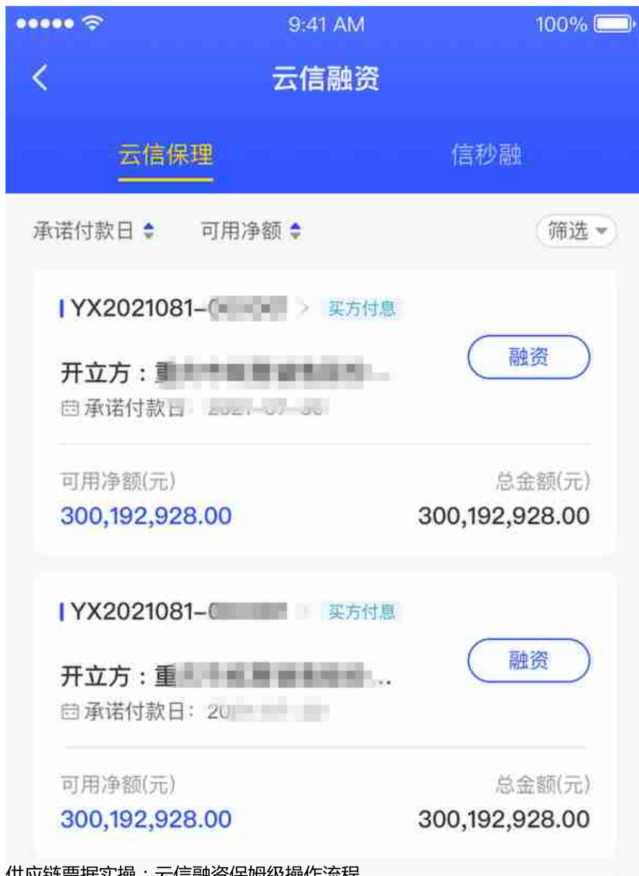
供应链票据实操：云信融资保姆级操作流程