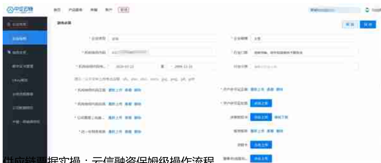
供应链票据实操：云信融资保姆级操作流程

补充完毕后，登录审核人账号，点击【产品服务】→【云信】→【云信融资】→【申请融资】，找到需要融资的云信，点击【融资】，客户根据实际情况自主选择融资路径。融资分为定价和询价两种模式。