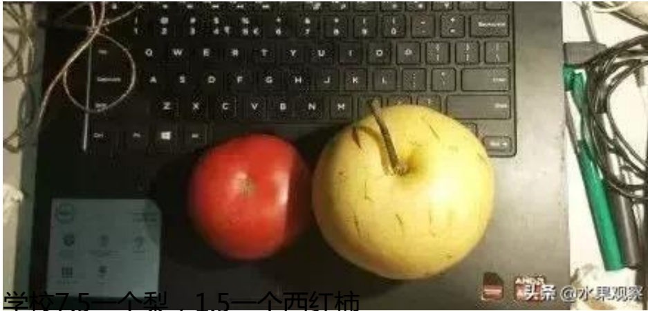
学校7.5一个梨，1.5一个西红柿