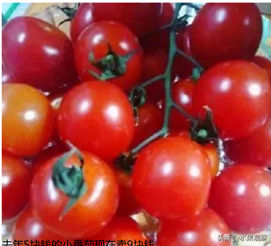
去年5块钱的小番茄现在卖9块钱