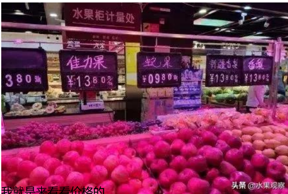
我就是来看看价格的