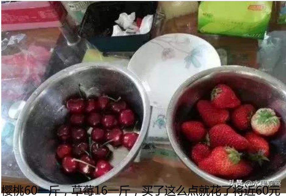
樱桃60一斤，草莓16一斤，买了这么点就花了将近60元