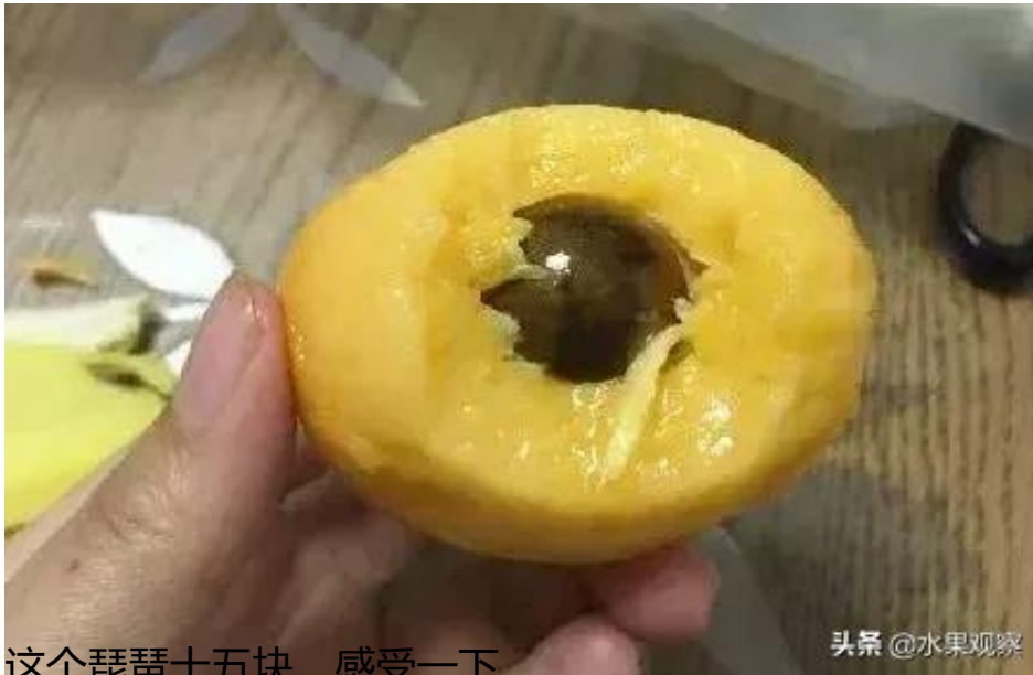
这个琵琶十五块，感受一下