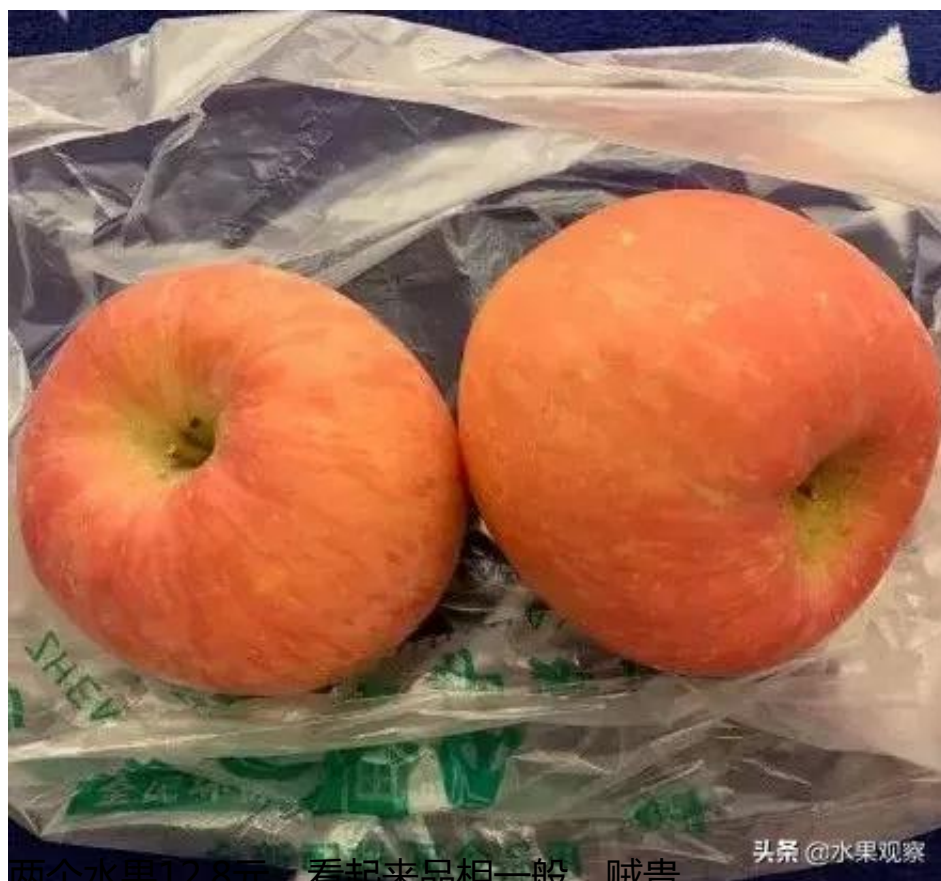
两个水果12.8元，看起来品相一般，贼贵