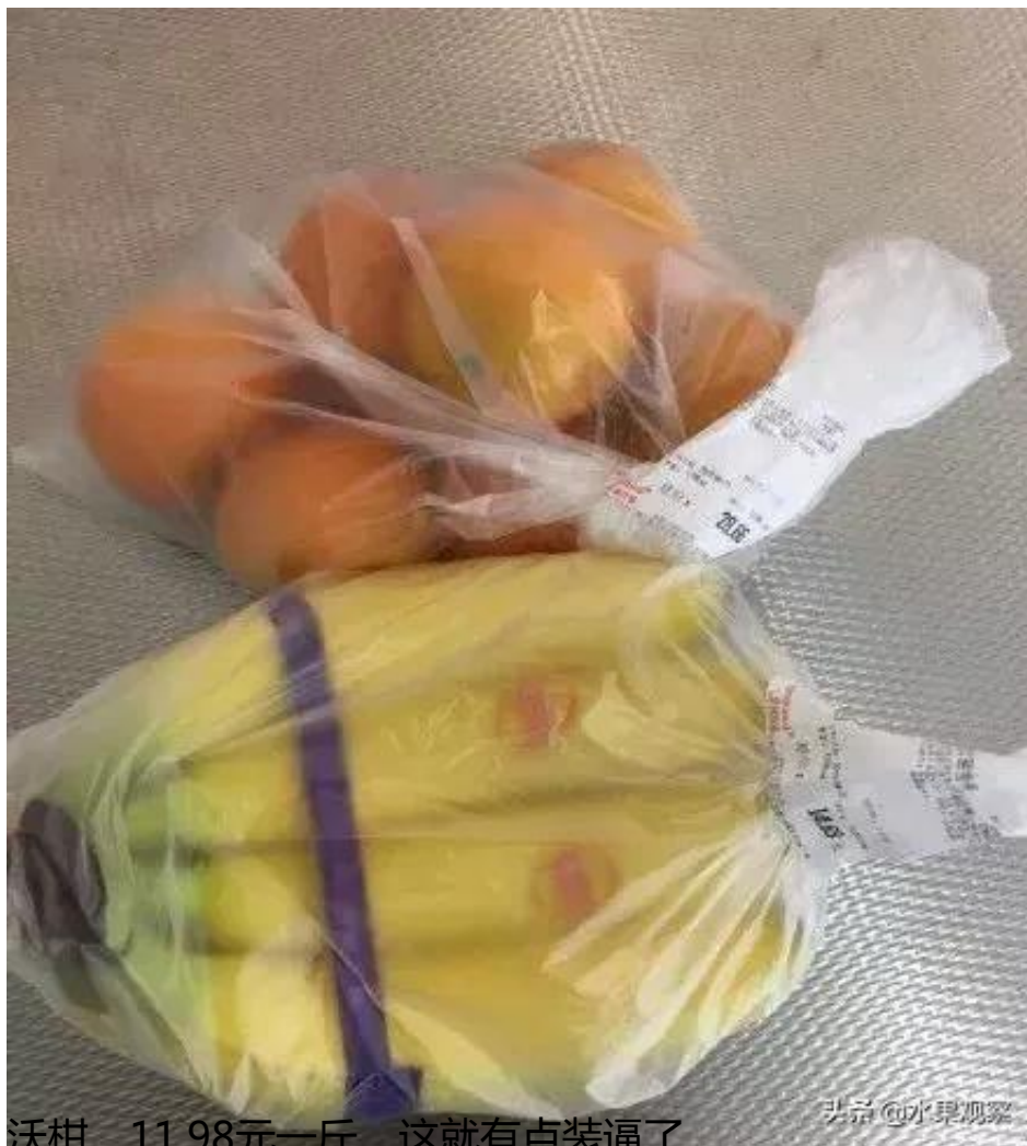
沃柑，11.98元一斤，这就有点装逼了

一线城市的水果价格果然不低，除了深圳的数据有点奇怪，看看北京和上海的水果价格上涨差不多都有30%，部分水果价格翻倍，二线城市的情况怎么样呢？