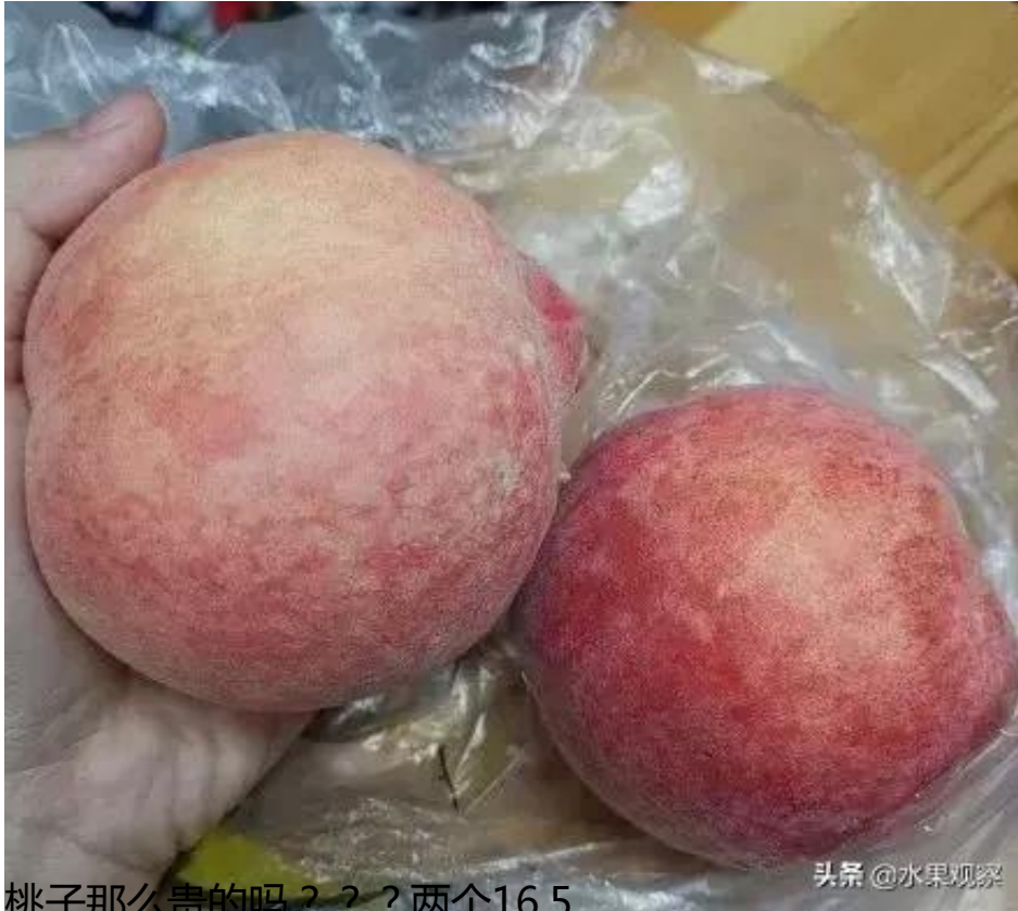
桃子那么贵的吗???两个16.5.....