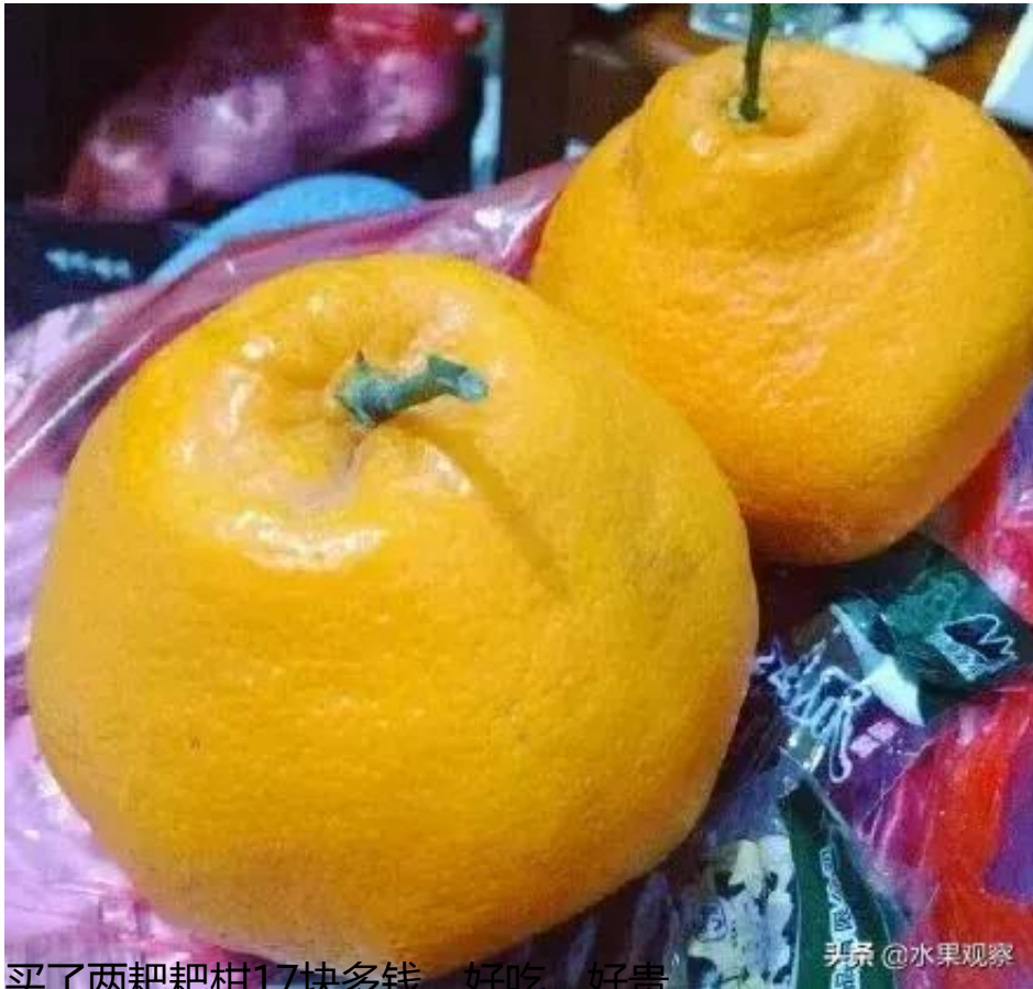
买了两耙耙柑17块多钱，好吃，好贵