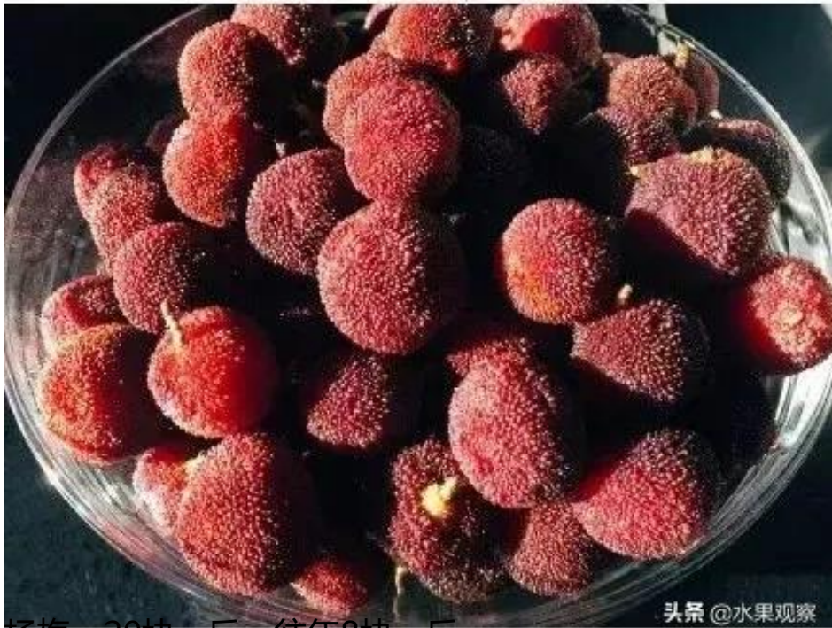
杨梅，20块一斤，往年8块一斤