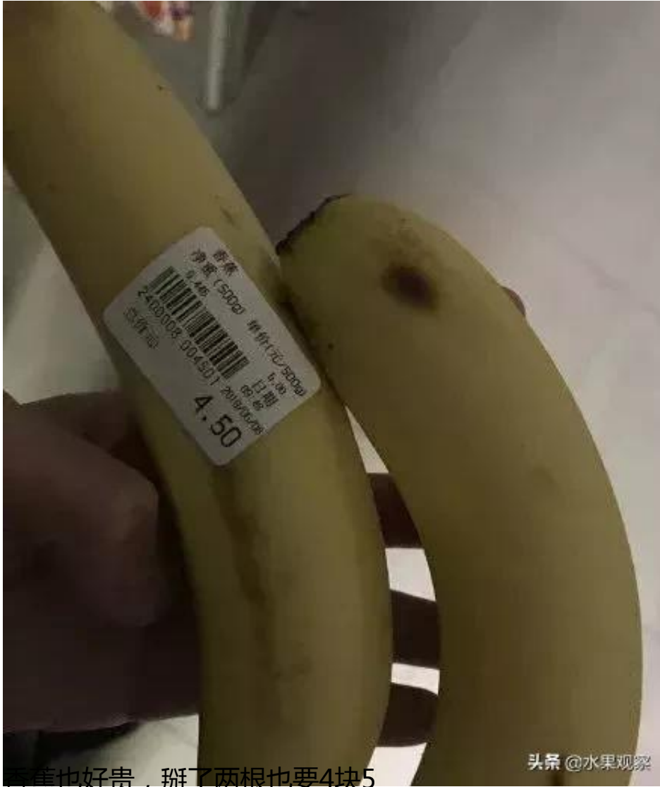
香蕉也好贵，掰了两根也要4块5