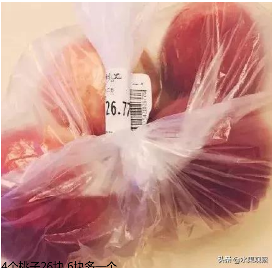
4个桃子26块 6块多一个