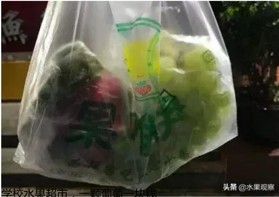
学校水果超市，一颗葡萄一块钱