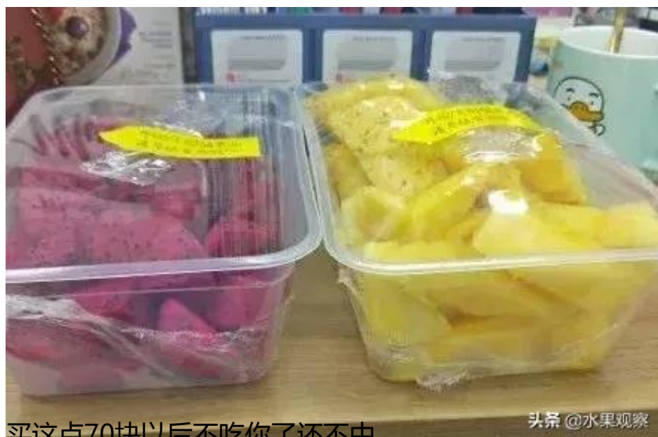
买这点70块以后不吃你了还不中