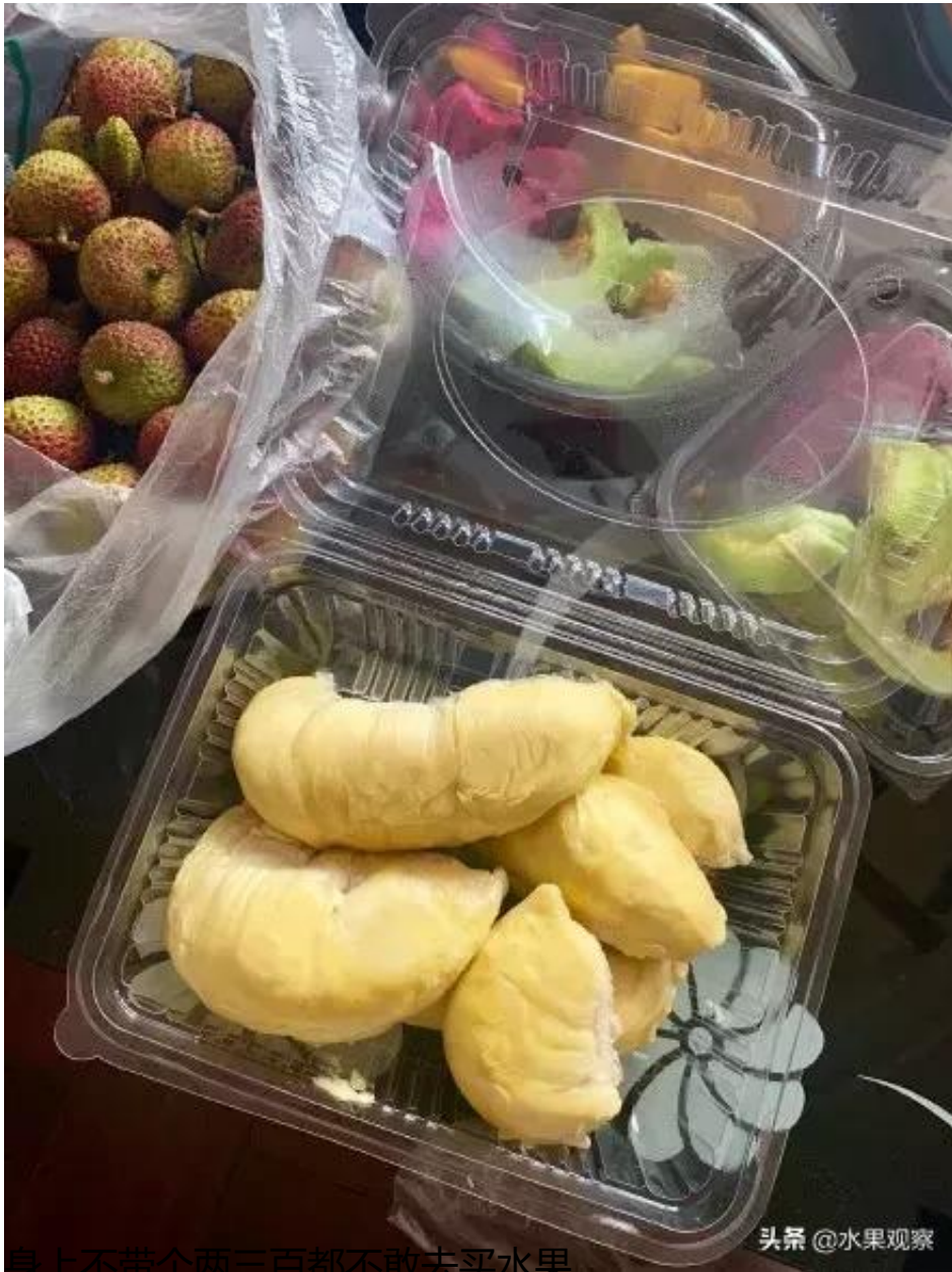
身上不带个两三百都不敢去买水果