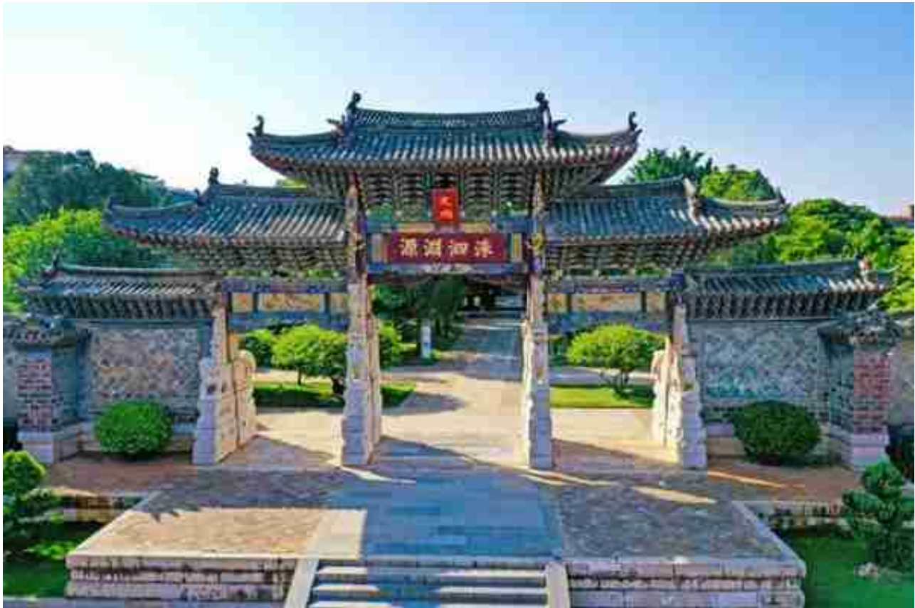
(建水文庙)

从2005年首次举行大型祭孔仪式以来，建水文庙在每年孔子诞辰之日及重要节假日都会举办祭孔活动，纪念先哲孔子，弘扬民族优秀文化。在传统祭祀中感受儒家思想在建水这块土地上的传续与发展，也让来自各地的游客感受到最真实、本土的建水儒家文化。