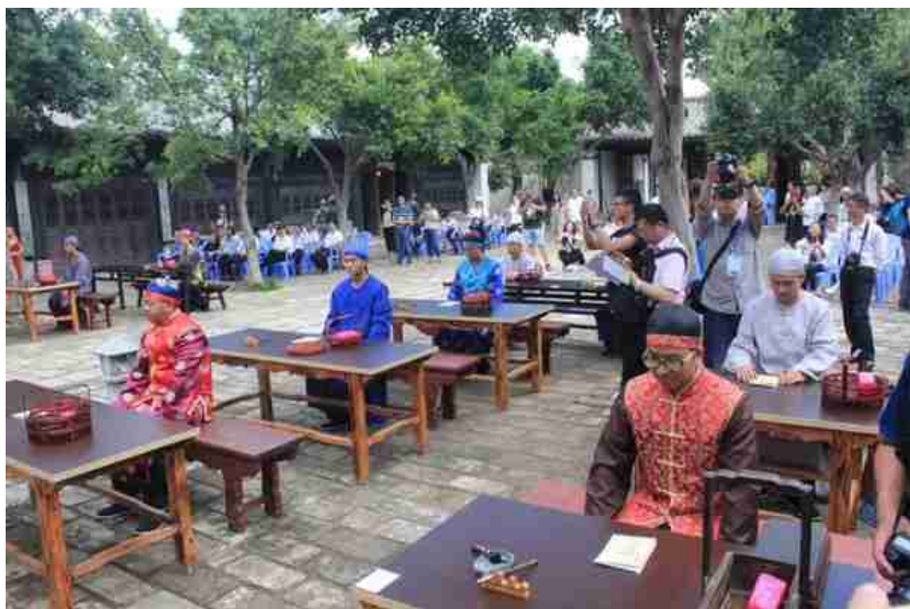
( 游客体验科考 )