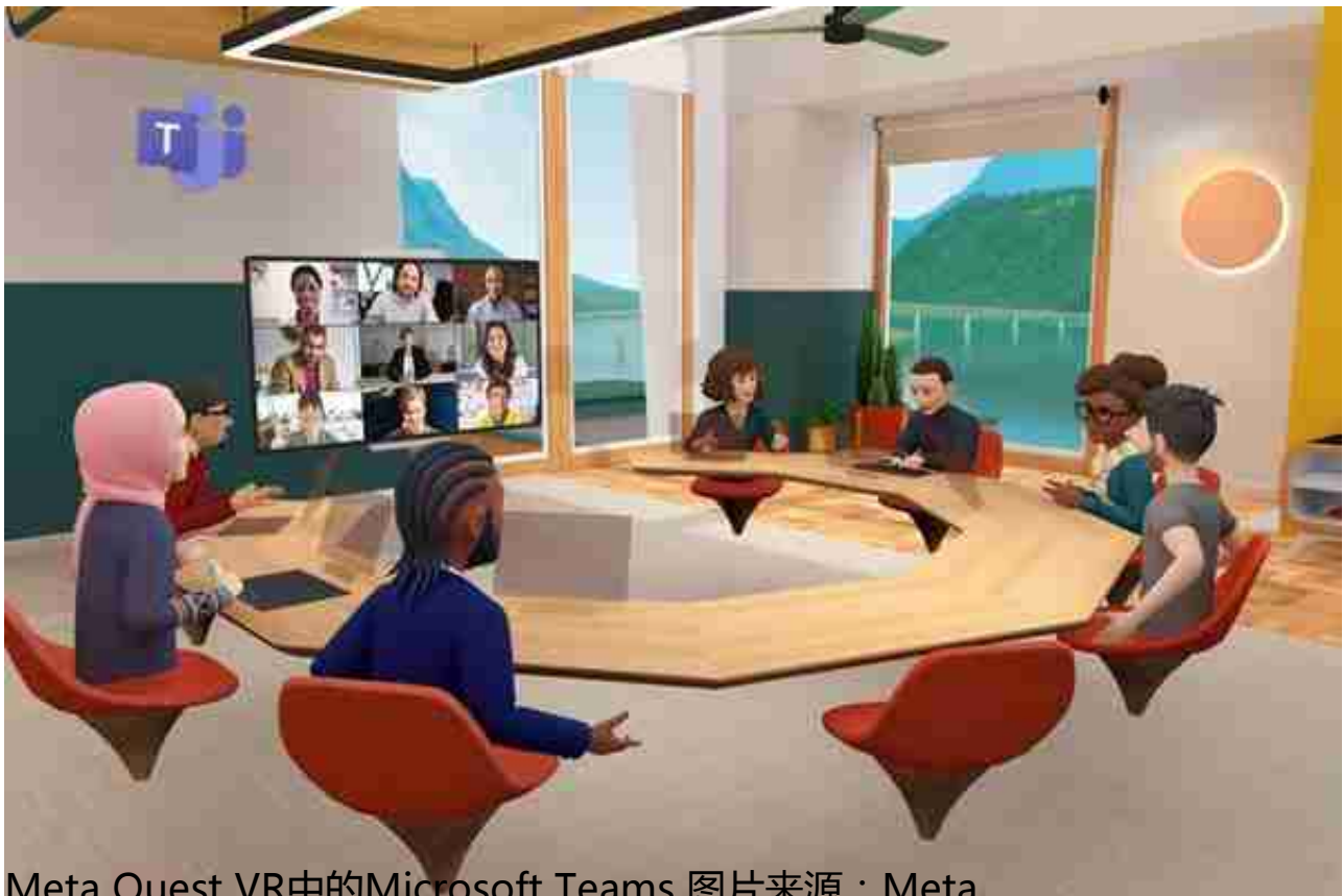
Meta Quest VR中的Microsoft Teams

随着Meta近期负面新闻层出不穷，越来越多人对其所描绘的乌托邦式的未来感到疑惑和失望，扎克伯格此时急需出面做一些回应。他在采访中承认元宇宙计划的长期性，预计在未来几年不会赚到钱，但他仍然将VR和AR头戴设备视为下一个主要计算平台，并希望成为推动这一转变的人。他还暗示，Meta未来会和苹果展开正面竞争。