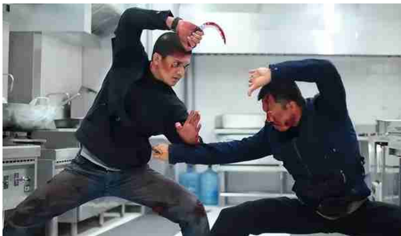
1 : 《杀破狼》2005年 | 中国香港