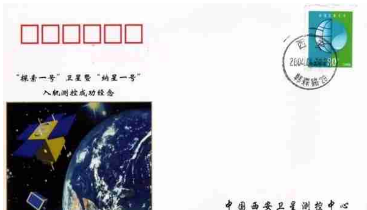
“探测一号”卫星暨“纳星一号”入轨测控成功纪念封