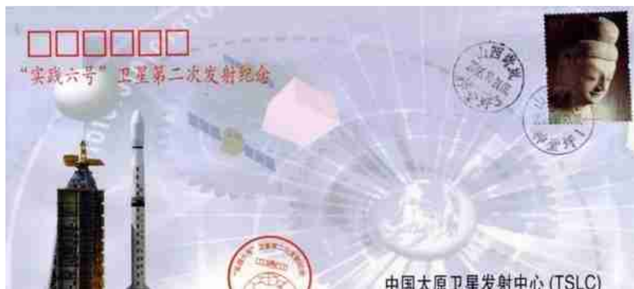
“实践六号”卫星第二次发射成功纪念封