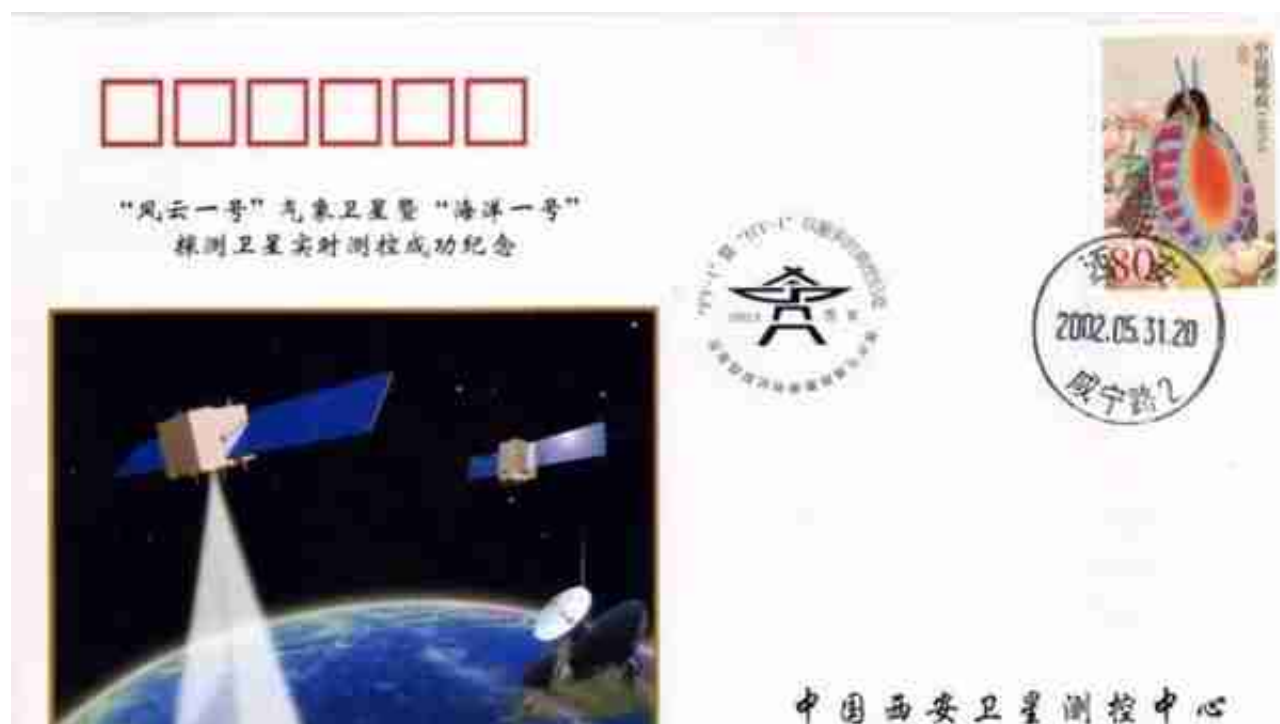
“风云一号”气象卫星暨“海洋一号”探测卫星实时测控成功纪念封