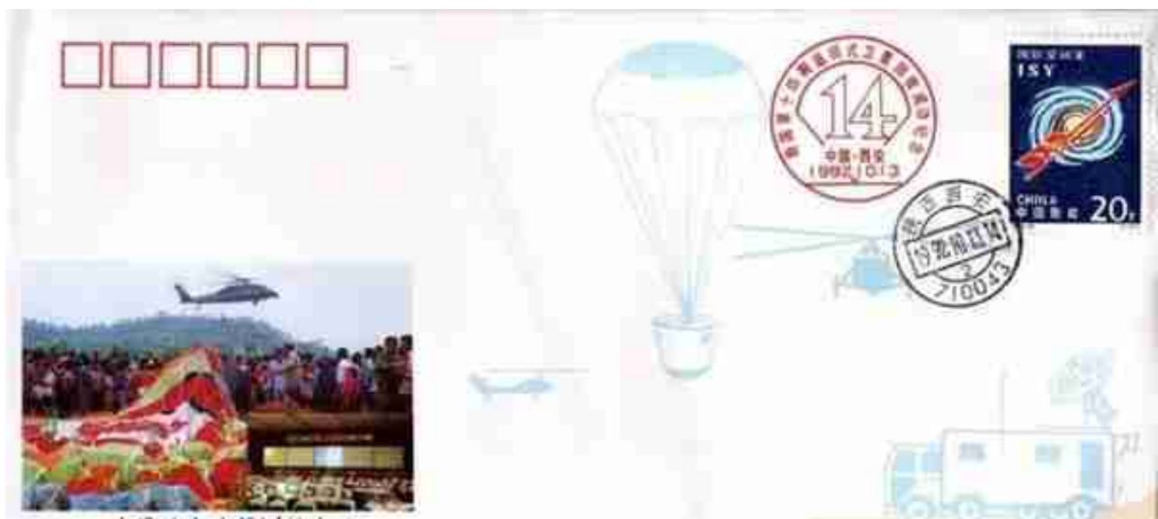
1992F14--总149我国第十四颗返回式科学控制卫星回收成功纪念封