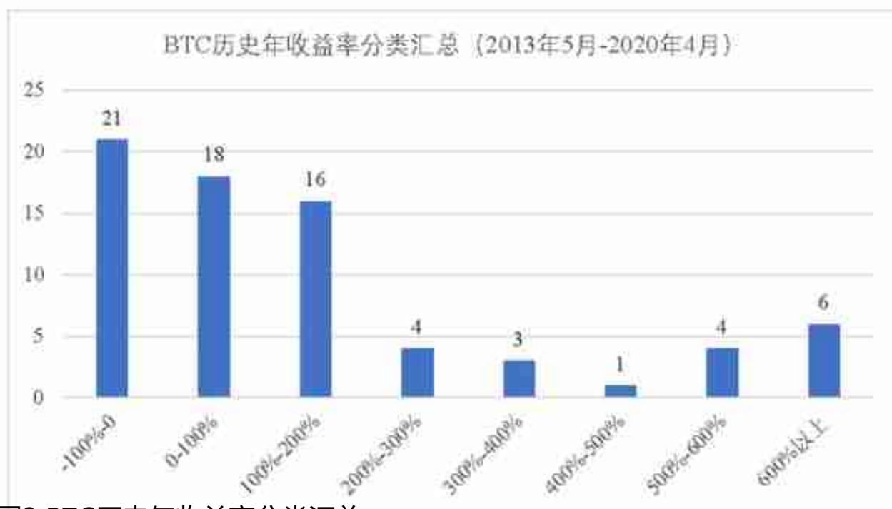
图3 BTC历史年收益率分类汇总

在上图和上表中，我们从2013年5月开始，以年为周期，统计了73个周期，平均收益率为176.03%。其中收益率为正的有52个，为负的有21个。分类汇总情况如下：