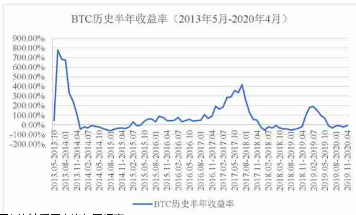
图1 比特币历史半年回报率