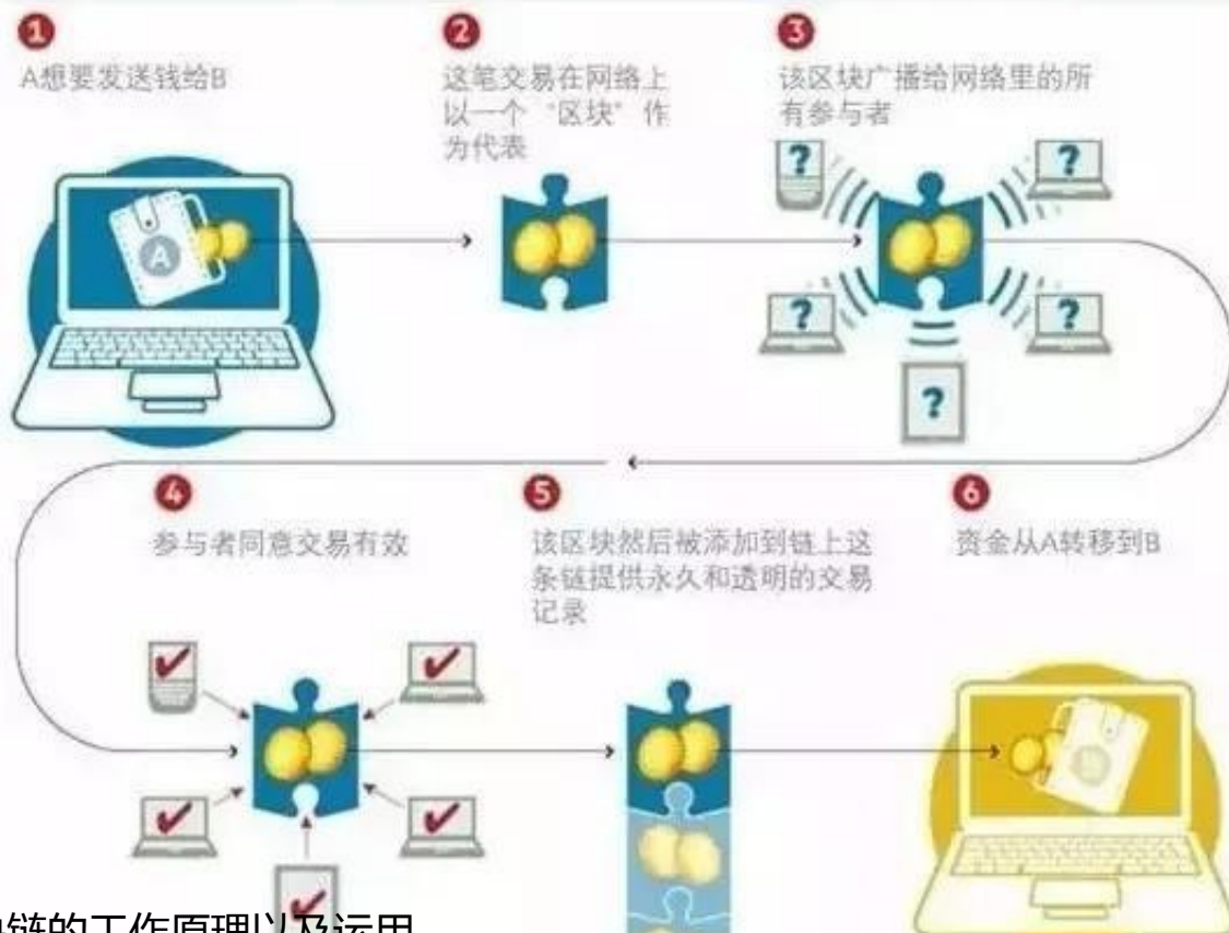
区块链的工作原理以及运用

区块链技术是分布式账本技术中的一种，比特币所采用的就是区块链记账技术，其原理如图