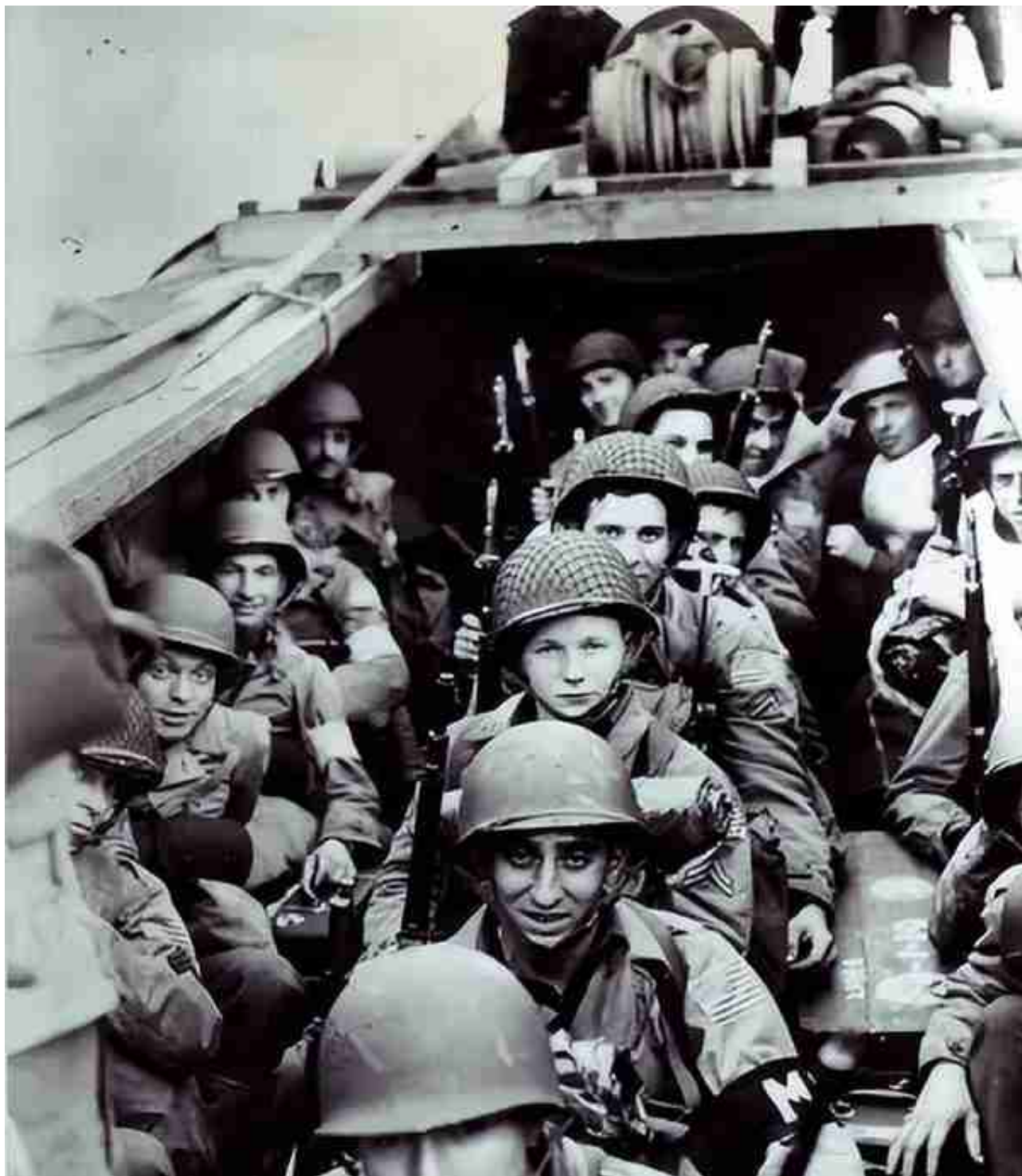
▲ 这支部队是M1903和M1混装

但结果等太平洋战争爆发，美军就傻了，由于换装速度缓慢，美军根本拿不出足够多的M1加兰德，很多士兵只能拿着M1903上战场，但M1903在面对疯狂冲锋的敌人时射速太慢了，要不是陆战1师在班一级配备了勃朗宁M1917，恐