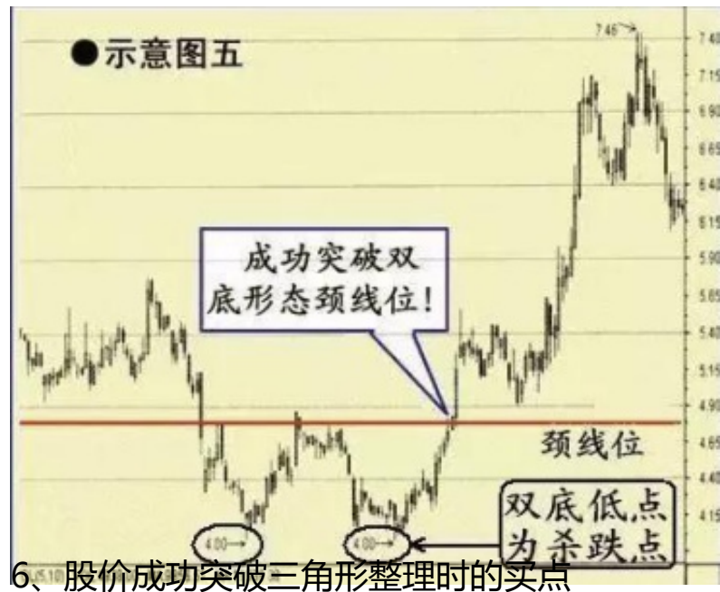
6、股价成功突破三角形整理时的买点