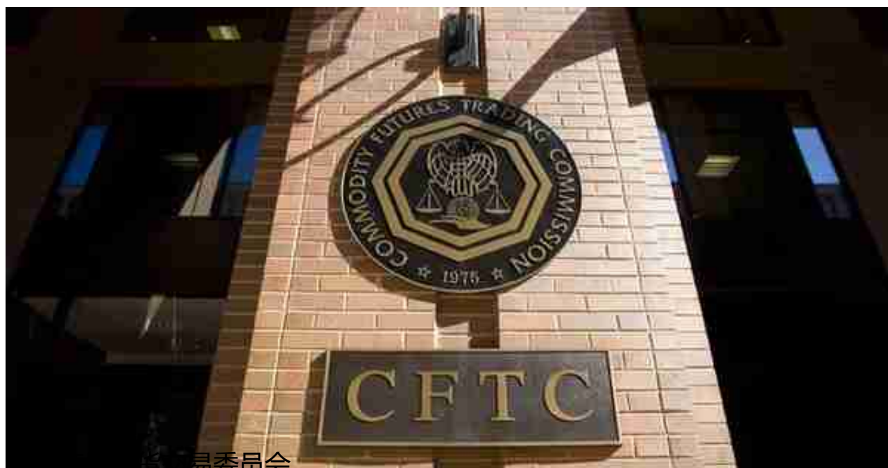
美国商品期货交易委员会

正是由 于来自现实世界的强力监管， 所以比特币等数字货币才会开启暴跌模式。 所以不要以为虚拟货币是虚的，和现实没有关系，它实际上和现实的关系不仅不小，而且很深。