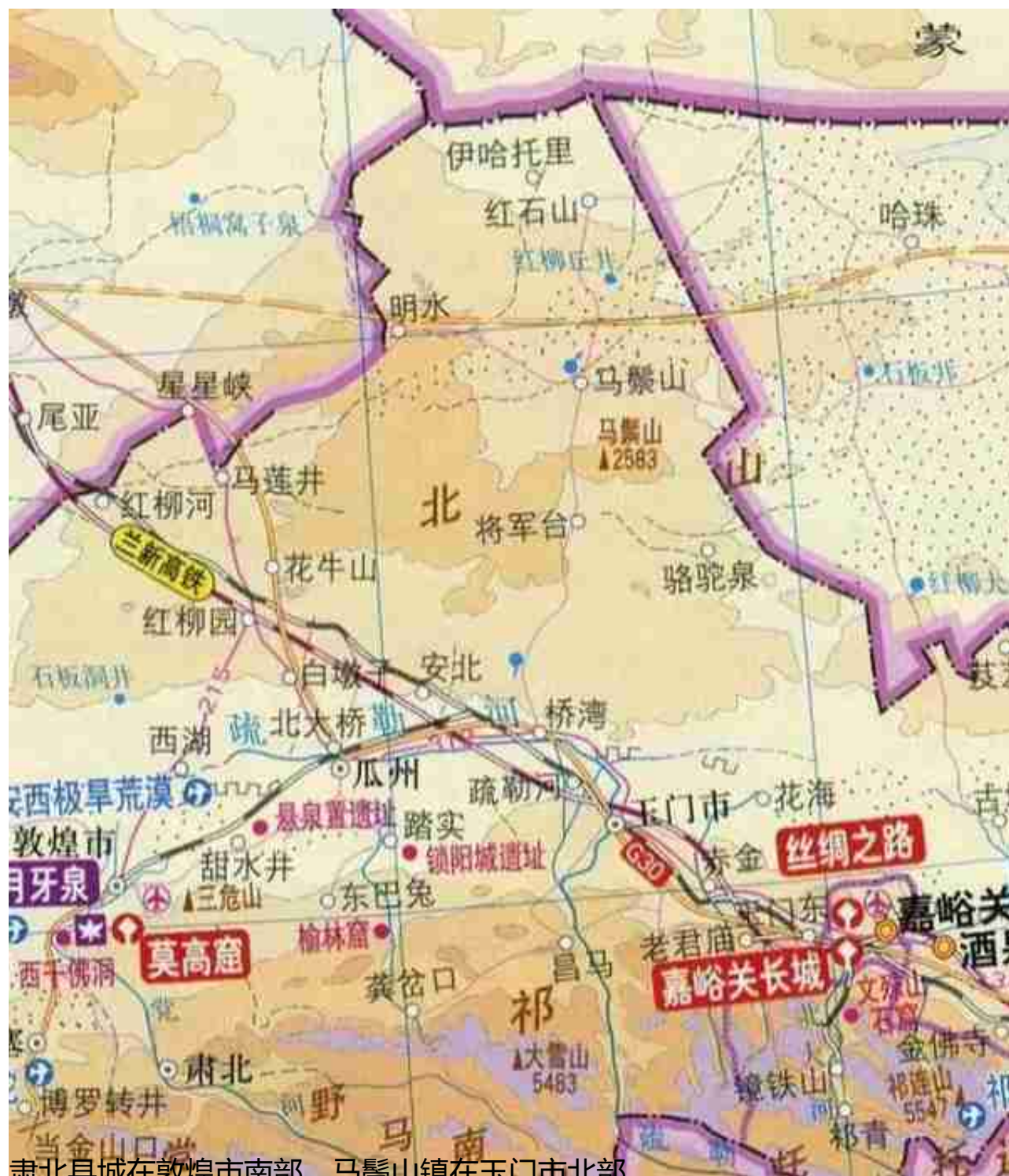
肃北县城在敦煌市南部，马鬃山镇在玉门市北部

作为一个新疆人，我曾多次往返于新疆与江苏之间，每次都要路过甘肃省。但直到最近我才知道甘肃这个省名取甘州、肃州二地的首字，甘州就是现在的张掖，肃州就是酒泉。