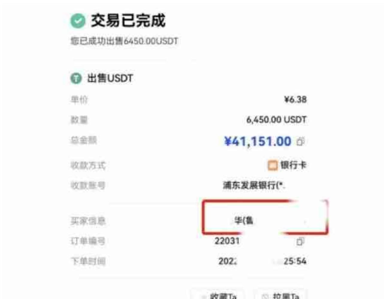
张三交易虚拟币的记录