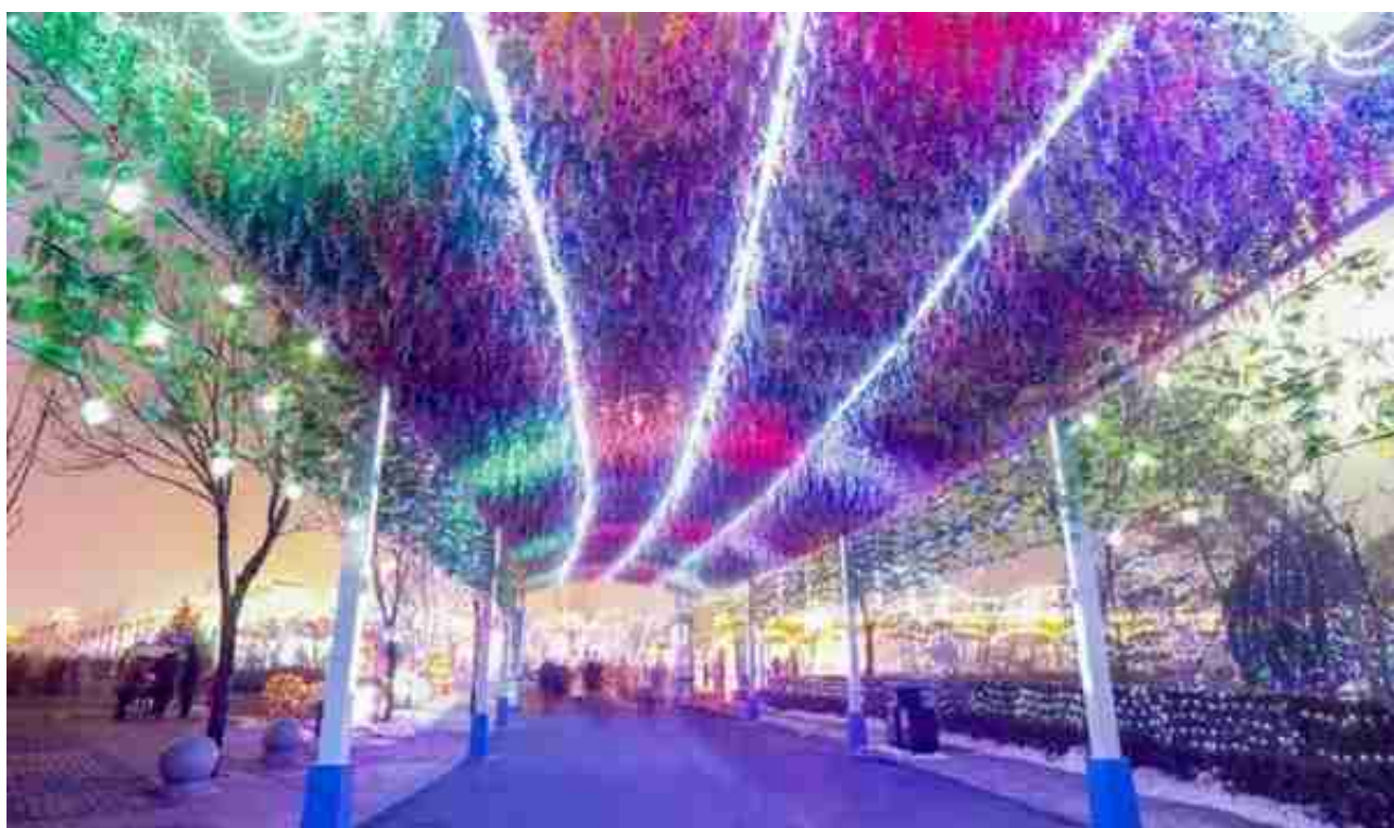
炫到极致的灯光艺术