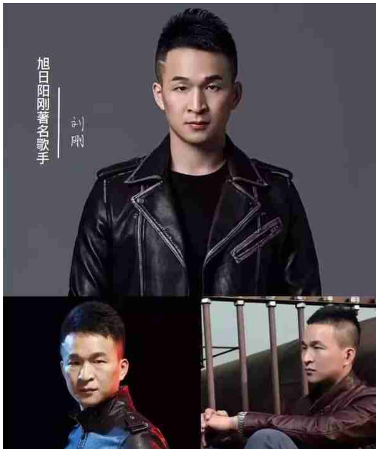
旭日阳刚演唱组-刘刚