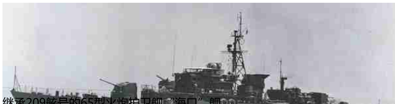
继承209舷号的65型火炮护卫舰“海口”舰

“长沙”舰于1954年5月随舰队配合陆军收复东矾列岛，于5月16日随随“南昌”、“广州”、“开封”等舰参加东矾列岛海战，与台方“太和”舰发生交火，是该舰参加的最重要的一次军事行动。