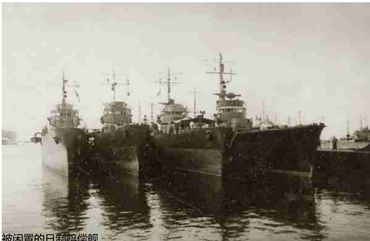
被闲置的日制赔偿舰

1947年7月至10月，国民党海军总共分四批接收了34艘日本赔偿舰，由于同期大量