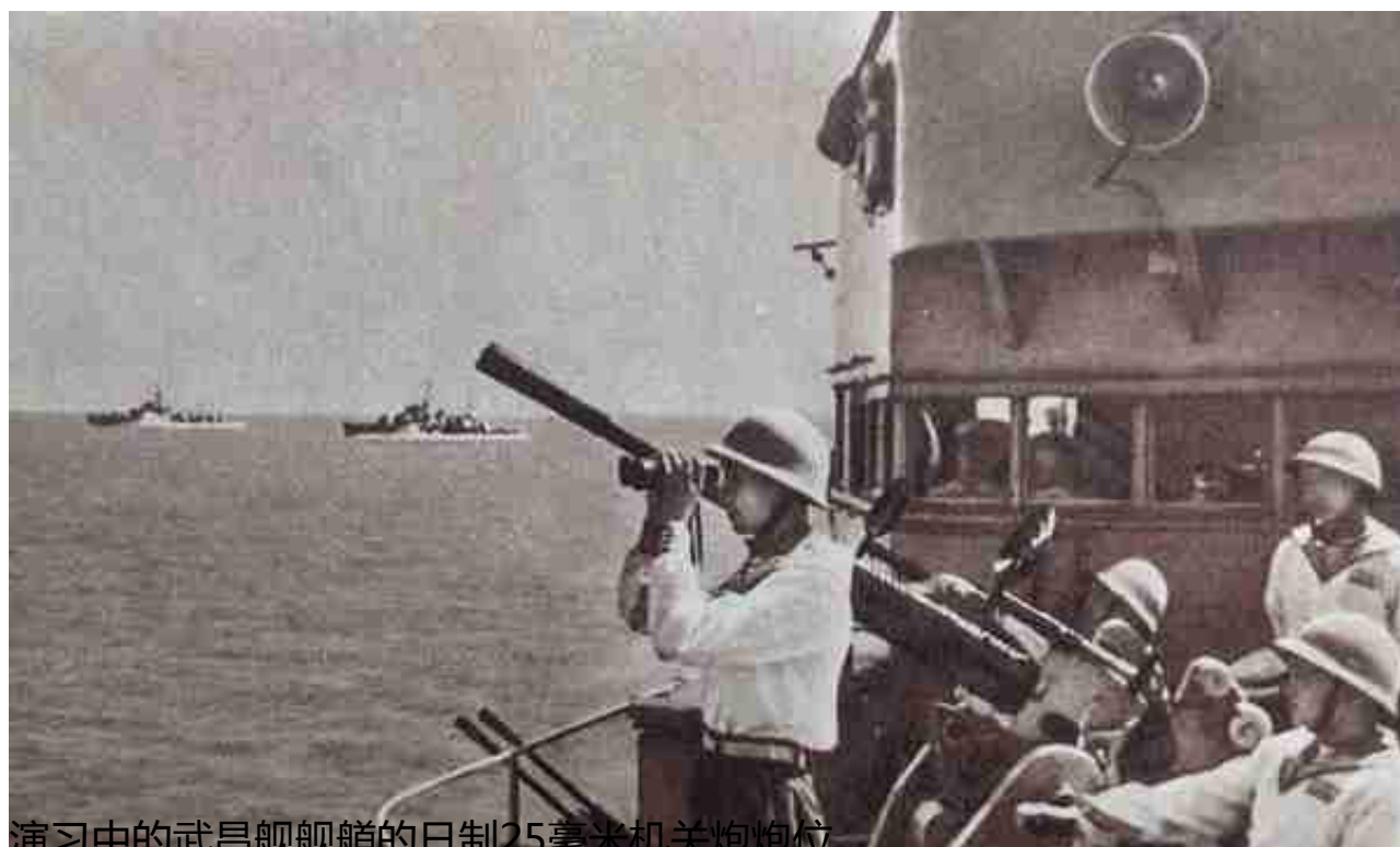
演习中的武昌舰舰艏的日制25毫米机关炮炮位