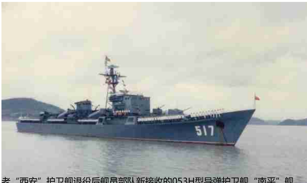
老“西安”护卫舰退役后舰员部队新接收的053H型导弹护卫舰“南平”舰

“西安”舰的舰名由051型导弹驱逐舰106舰继承（退役后停泊于武汉作为国防爱国主义教育基地供人参观），如今的“西安”号舰名属于新一代052C型导弹驱逐舰153舰；527的舷号则由053H3型导弹护卫舰“洛阳”号继承。