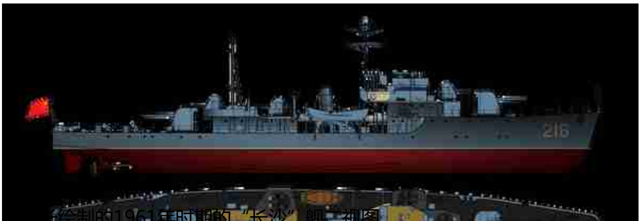
中广绘制的1961年时期的“长沙”舰二视图