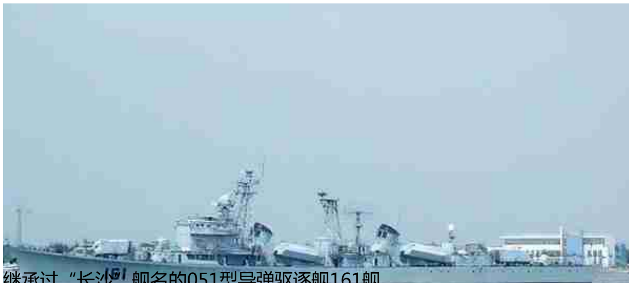
继承过“长沙”舰名的051型导弹驱逐舰161舰