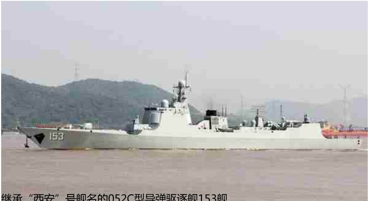
继承“西安”号舰名的052C型导弹驱逐舰153舰