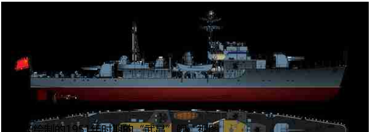
中广绘制的1951年时期的“武昌”舰二视图